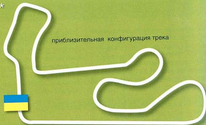
приблизительная конфигурация трека